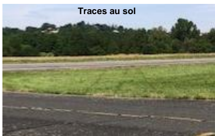
Traces au sol