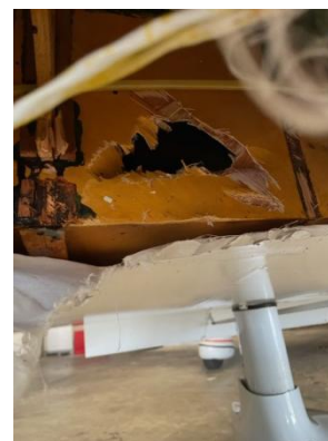
Dégâts sur le longeron