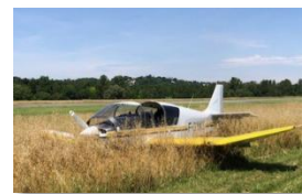
Avion immobilisé suite à sa sortie de piste